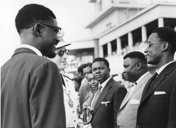
Eerste minister Patrice Lumumba stelt koning Boudewijn de leden van zijn ministerie voor: rechts Joseph-Désiré Mobutu, 29/06/1960

Patrice Lumumba, winnaar van de verkiezingen, wordt op 21 juni aangesteld als formateur. Op 24 juni krijgt hij het vertrouwen van Kamer en Senaat en wordt hij benoemd tot eerste minister. Diezelfde dag wordt Joseph Kasavubu tot president verkozen. Het politieke systeem van de nieuwe republiek is gebaseerd op dat van België, dus de president heeft voornamelijk een protocollaire rol. Op 17 juni 1960 neemt het Belgische Parlement de wet aan die Belgische bedrijven met een koloniaal statuut in Congo de mogelijkheid biedt te kiezen tussen de Belgische en de Congolese nationaliteit. De meeste opteren voor de Belgische. Deze wet ligt aan de basis van het Belgisch-Congolese geschil: vele Congolezen opperen dat België misschien wel de politieke macht overdraagt, maar niet zijn greep op het Congolese economisch patrimonium.