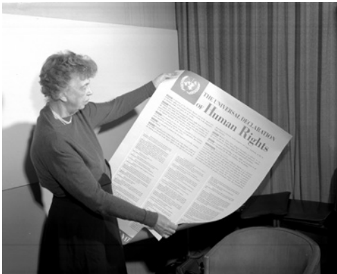
Eleanor Roosevelt houdt de Universele Verklaring van de Rechten van de Mens vast 1948

Van 18 tot 24 april 1955 vindt in Bandung (Indonesië) de eerste Afro-Aziatische conferentie plaats. Ze verenigt de vertegenwoordigers van 29 Afrikaanse en Aziatische landen die hun onafhankelijkheid hebben verworven. Politici zoals Nasser (Egypte), Nehru (India), Sukarno (Indonesië) en Zhou Enlai (China) maken deel uit van het gezelschap. De conferentie markeert de intrede van de 'Derde Wereld' op de internationale scène. Ze veroordeelt de kolonisatie en het imperialisme, het racisme en de apartheid in Zuid-Afrika. De ondertekenende landen roepen de nog gekoloniseerde landen op te strijden voor hun onafhankelijkheid, maar beklemtonen dat een vreedzame oplossing en het streven naar onderhandeling altijd de voorkeur wegdragen. Deze 29 zogenaamde 'niet-gebonden' landen benadrukken tevens dat ze niet willen worden betrokken bij de Koude Oorlog en dat ze weigeren te behoren tot een van de twee machtsblokken gevormd door de Verenigde Staten en de Sovjet-Unie.