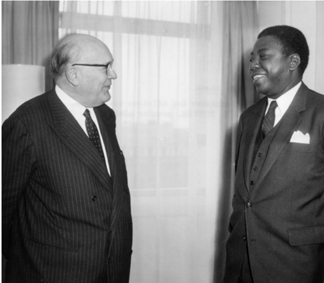
Ontmoeting tussen Paul-Henri Spaak en Moïse Tshombe

Vandaag wonen veel nakomelingen van Congolezen die een historische rol hebben gespeeld tijdens de onafhankelijkheid, in België. Dat geldt vooral voor de kinderen en kleinkinderen van een aantal Congolese vertegenwoordigers op de rondetafelconferentie 50 jaar geleden.