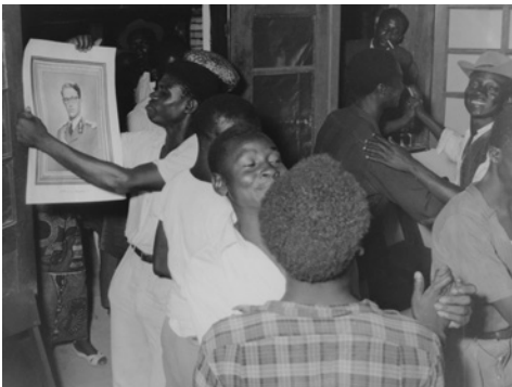
Uitgelatenheid bij het bezoek van koning Boudewijn aan Kamina KMMA

problemen herleidt ze echter al te vaak tot persoonlijke geschillen tussen 'blanken' en 'zwarten', terwijl ze de juridische en administratieve ongelijkheden loochent waarop hun relaties stoelen.