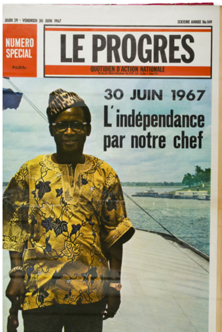
Propagandadocument van de MPR KMMA

Joseph Kasavubu blijft president tijdens de Congolese crisis. Na het einde van de rebellie vormt Moïse Tshombe een regering van Algemeen Welzijn die Congolezen met elkaar moet verzoenen en rust moet brengen in het land. Een nieuwe, federale grondwet laat het meerpartijenstelsel toe en verdeelt het land in 21 provincietjes die overeenkomen met de voormalige districten uit de koloniale periode. In 1965 organiseert Congo parlementsverkiezingen. Vrouwen krijgen geen stemrecht, dat is nog altijd beperkt tot mannen. Na de verkiezingen vervangt Joseph Kasavubu Tshombe door Évariste Kimba. Een maand na de benoeming van Kimba, werpt kolonel Mobutu de president en de eerste minister omver.