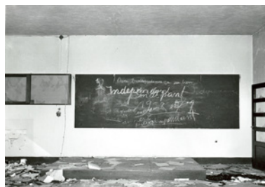
Na de rellen 01/1959