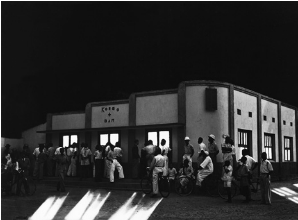
De Kongo Bar, een van de dancings van de 'inheemse wijk' in Leopoldstad

In de 'inheemse' wijk van Leopoldstad, streven sommige jongeren naar moderniteit zonder dat ze daarom 'évolués' willen of kunnen worden. Ze ontwikkelen een tegencultuur die subversief en marginaal is maar uiteindelijk heel invloedrijk zal blijken. De Bills (afgeleid van Buffalo Bill), die zich laten inspireren op de cowboys uit Amerikaanse westerns, ontwikkelen via mode, slang en muziek hun eigen culturele codes. Deze jongeren- en stadscultuur blijft onzichtbaar in de beelden die Inforcongo verspreidt, die vooral 'primitieve' Congolezen op het platteland, 'évolués' in de stad en arbeiders in industriële centra toont. Er zijn wel veel Bills te zien op de foto's van Depara, de huisfotograaf van Franco, de zanger van OK Jazz, het orkest dat vanaf 1956 met stijgend succes speelt in de bars en dancings van de 'inheemse' wijk.