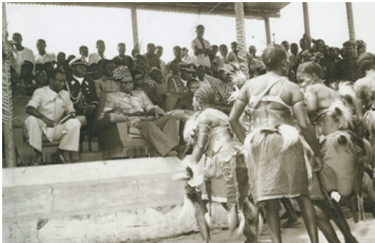
Zonder titel KMMA

In 1974 is het Mobutu-regime op zijn hoogtepunt. De terugkeer naar de authenticiteit en de zaïrisering inspireren de Congolezen, die fier zijn op het culturele en economische kapitaal van hun land en zijn inwoners. 1974 is ook het jaar van de beroemde bokswedstrijd in Kinshasa tussen Muhammad Ali en George Foreman, en het jaar dat Zaïre als eerste sub-Saharaans land een finaleplaats in de Wereldbeker voetbal haalt. Tegelijkertijd luidt 1974 ook het begin van het economische verval van Zaïre in: corruptie grijpt om zich heen en de staatsstructuren storten in elkaar. Het instandhouden van de personencultus van Mobutu gebeurt niet zonder geweld. Elk protest wordt brutaal de kop ingedrukt. De dictatuur zorgt voor een hersenvlucht, vooral naar België en Frankrijk.