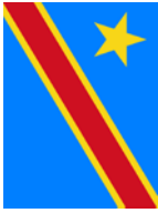
R D CONGO