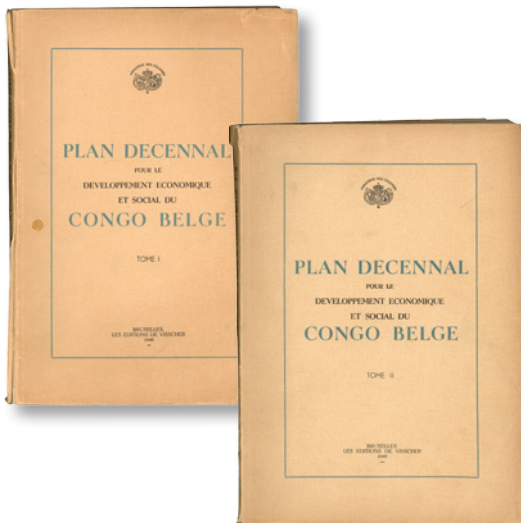
Tienjarenplan voor de economische en sociale ontwikkeling van Belgisch Congo, deel I-II Brussel, Les Éditions de Visscher, 1949 KMMA

Het woord 'évolué' is een vaag omschreven term, die verwijst naar zogeheten 'beschaafde' Congolezen. Aan de vooravond van de onafhankelijkheid, opperen sommige Belgische waarnemers dat slechts 1% van de Congolezen als 'évolué' beschouwd kan worden. De koloniale administratie remt inderdaad de ontwikkeling van een tussenklasse af: 'geen elite, geen heibel'. Ze wil de meeste Congolezen wel basisonderwijs bieden, maar daar blijft het dan ook bij. Na de Tweede Wereldoorlog lanceert de administratie de zogeheten carte de mérite civique , een soort bewijs van burgerlijke verdienste. Als koloniale onderdanen hebben ze sowieso niet dezelfde rechten als Belgische burgers. Het onderwijs voor meisjes wordt, in vergelijking met dat voor jongens, volledig verwaarloosd. Het koloniale systeem ontnemt de Congolese vrouwen hun politieke rechten en economische onafhankelijkheid: hun plaats is aan de haard, hun professionele mogelijkheden zijn beperkt. Ze krijgen een ambigue rol toebedeeld: ze moeten zich 'beschaven', maar gelden tezelfdertijd als hoedsters van prekoloniale tradities. Aan de vooravond van de onafhankelijkheid heeft geen enkele Congolese vrouw een universitair diploma.