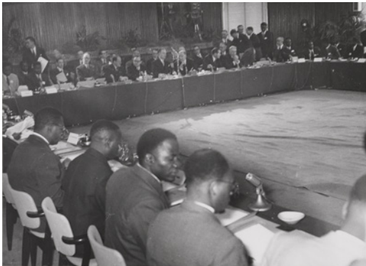
Openingssessie Congrespaleis 20/01/1960

In volle verkiezingscampagne sturen Patrice Lumumba (MNC), Joseph Kasavubu (ABAKO) en de andere leiders studenten naar de rondetafelconferentie om hen te vertegenwoordigen. Sommigen menen dat ze te jong en onervaren zijn. Voor Kasavubu dient deze ontmoeting alleen maar om 'te zien wat er in de dossiers staat' ; hij vraagt er via een persbericht het verslag van op. In die dossiers wordt echter gesproken over de reserves van de Centrale Bank. Met andere woorden, het gaat hier om de portemonnee van de kolonie, die naar schatting tussen 35 en 37 miljard Belgische frank bedraagt. De Belgische delegatie is wel goed voorbereid en wint terug wat ze tijdens de eerste rondetafelconferentie op politiek vlak verloren had: het behoud van de Belgische ambtenaren, de twee militaire bases en de goed gevulde 'portemonnee' die aan de basis ligt van het geschil tussen België en Congo. Na deze tweede conferentie drukken de Belgische autoriteiten de wens uit voor een politiek gedekoloniseerd Congo, dat ze echter op economisch vlak nog in de hand hebben.