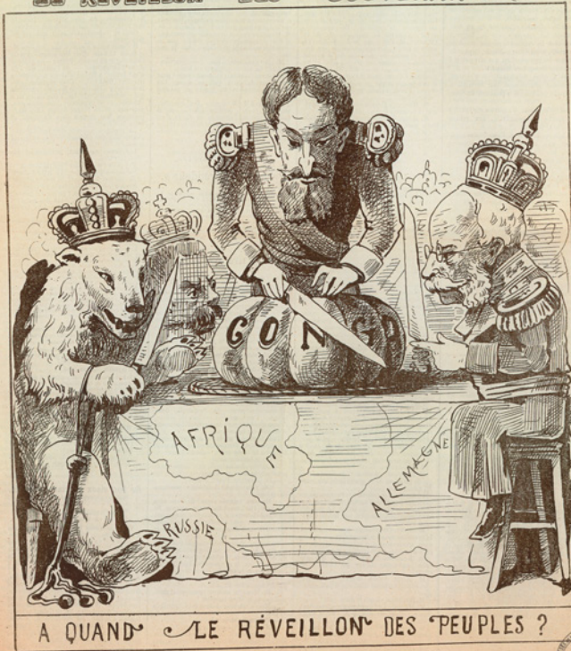
'Le réveillon des souverains ! À quand le réveillon des peuples ?' (De Honger van de soevereine vorsten! En de honger van het volk?)

Le Frondeur, 20/12/1884