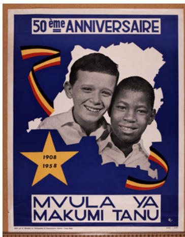
Affiche 50 ste verjaardag van Belgisch Congo, 1908-1958

uitvoer van die muziek, die later heel sub-Saharaans Afrika aan het dansen zal zetten. Binnen deze nieuwe cultuur wordt de rol van Afrikaanse vrouwen geleidelijk herleid tot die van consument.