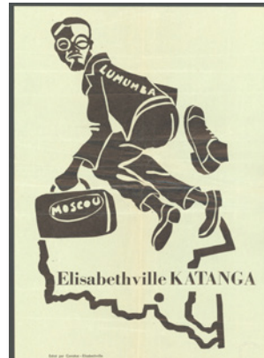
De Katangese afscheuring: documenten en foto's KMMA

Op 11 juli 1960 roept Moïse Tshombe, de voorzitter van CONAKAT, met de steun van België de onafhankelijkheid van de industriële provincie Katanga uit. Op 8 augustus 1960 roept Albert Kalonji van MNC-Kalonji, met de steun van de westerse landen, op zijn beurt eerst de autonome staat, later het federale koninkrijk