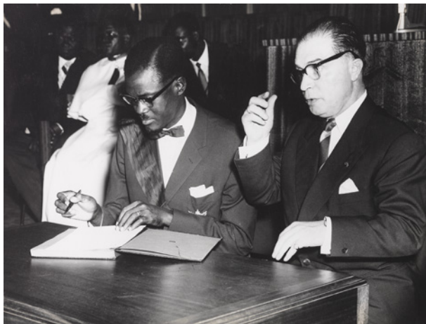
Eerste ministers Patrice Lumumba en Gaston Eyskens (ondertekening van de onafhankelijkheidsverklaring) Palais der Natie, 1960

De onafhankelijkheidsverklaring is een document van enkele lijnen waarin de politieke overdracht wordt geregeld, maar met geen woord over de overdracht van de economische rijkdommen wordt gerept. Die bondigheid is voor vele Congolezen een ontgoocheling. In de koloniale periode is het boek een belangrijk machtssymbool en de politieke machtsoverdracht heeft een grote symbolische waarde. Populaire afbeeldingen tonen hoe Koning Boudewijn, als vertegenwoordiger van de koloniale macht, de macht overdraagt op Patrice Lumumba, de Congolese eerste minister. In werkelijkheid tekenden de twee eerste ministers, Patrice Lumumba voor Congo en Gaston Eyskens voor België. Doorheen de jaren werd deze onafhankelijkheidsverklaring in de Congolese verbeelding een indrukwekkend 'Gulden Boek' dat het voorwerp blijft van talrijke mythes in Congo.