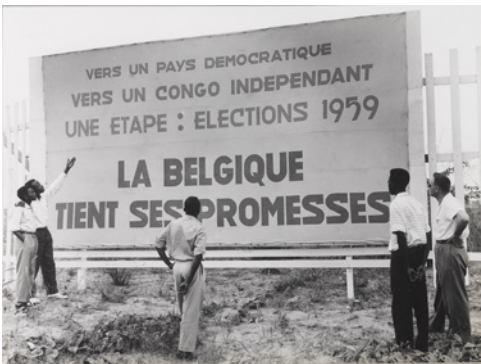
' La Belgique tient ses promesses ' (België houdt haar beloftes)